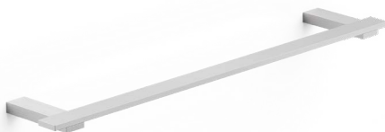
AK135 AK150 AK160